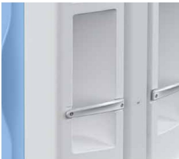
COMODI PORTABOTTIGLIE HANDY BOTTLE HOLDERS