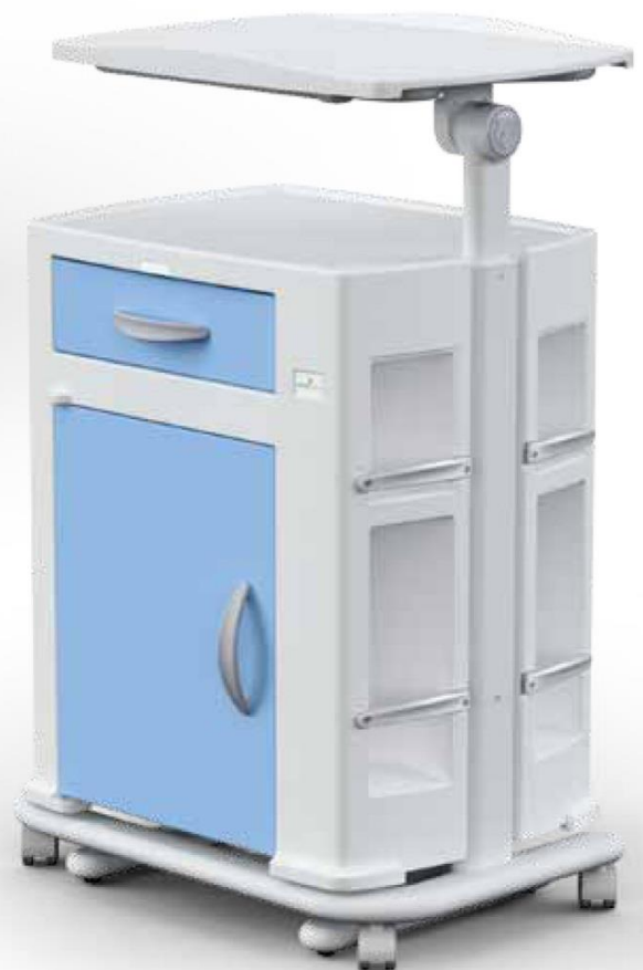
Comodino con tavolo servitore inclinabile a leggio su carrello (opzionale) Bedside cabinet with inclinable over bed table on trolley (optional)