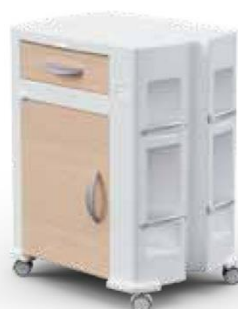
ROVERE COP K 1009