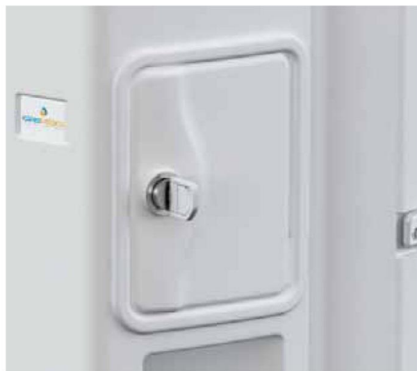
TESORETTO (OPZIONALE) PERSONAL ITEM COMPARTMENT (OPTIONAL)