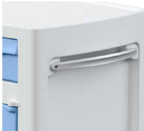
VANO LATERALE PORTA ASCIUGAMANI TOWEL HOLDER LATERAL COMPARTMENT