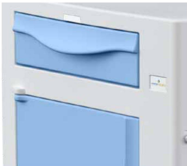
GEOMETRIA ARROTONDATA ROUNDED SHAPE