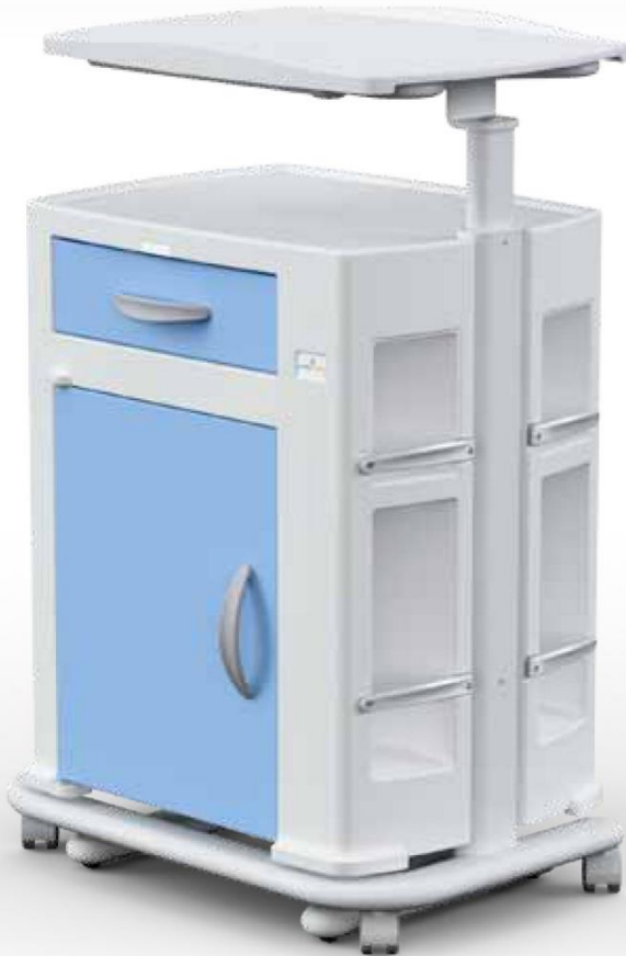
Comodino con tavolo servitore su carrello (opzionale) Bedside cabinet with over bed table on trolley (optional)