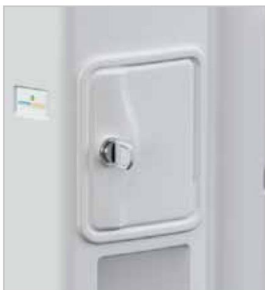
Disponibile anche con tesoretto integrato Built-in personal items storage compartment available