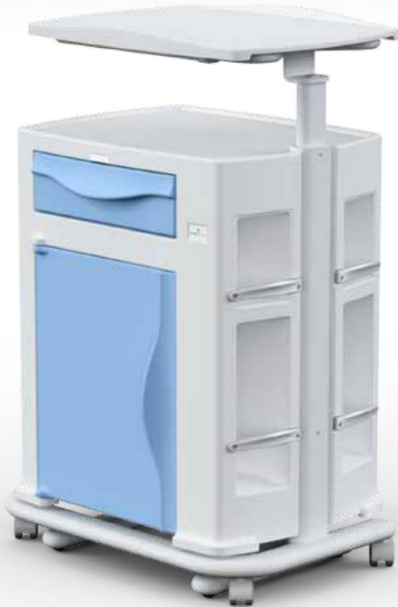
Comodino con tavolo servitore su carrello (opzionale) Bedside cabinet with over bed table on trolley (optional)