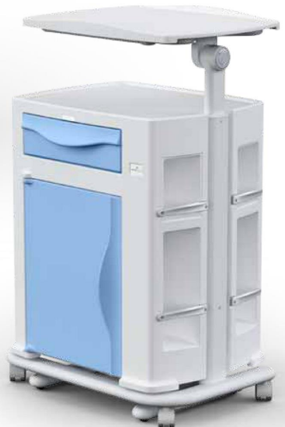
Comodino con tavolo servitore inclinabile a leggio su carrello (opzionale) Bedside cabinet with inclinable over bed table on trolley (optional)